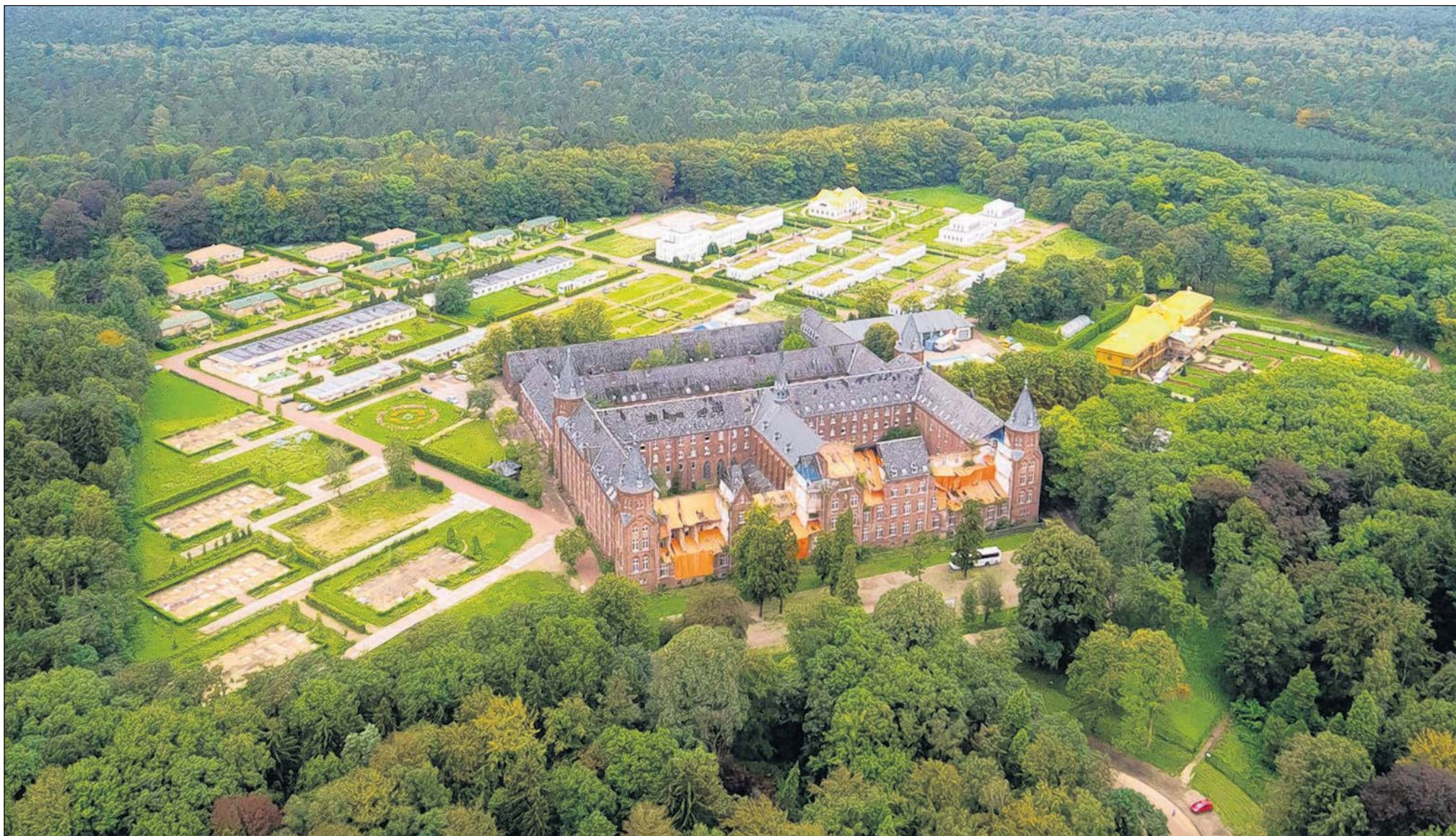
Het klooster Sankt Ludwig vanuit de lucht. Links naast het complex de plek waar tot voor kort nog

„Het is heel frustrerend voor ons dat het klooster al tien jaar slecht geconsolideerd is en dus heel veel heeft geleden. In de eerste acht jaar na de sloop is er nauwelijks iets aan behoud van het gebouw gedaan. Daardoor heeft het complex extra veel geleden. De gemeente heeft eigenlijk veel te laat ingegrepen.”